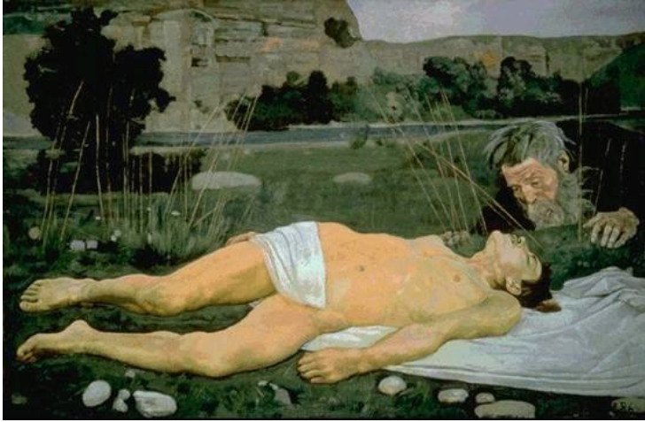
Ferdinand Hodler (1853 – 1918)

Een belangrijk element in het verhaal van de Barmhartige Samaritaan is de drieslag Zien – Bewogen worden – In beweging komen. Het 'zien' wordt treffend verbeeld in het schilderij van Ferdinand Hodler (1853 – 1918). Dat mensen zien, geraakt worden en in actie komen is wat de diaconie met het 'Jaar van de Samaritaan' beoogt.