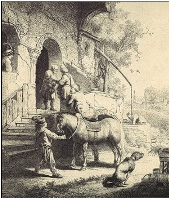
Rembrandt van Rijn (1606 – 1669)

Aansluitend bij kunsttradities in het verleden wordt in het 'Jaar van de Samaritaan' het verhaal op nieuwe manieren verbeeld en geplaatst in deze tijd. Daarmee wordt ook aangesloten op het landelijke 'Jaar van het Religieus Erfgoed' ( www.2008re.nl ).